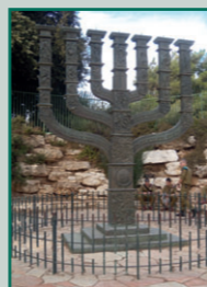
Die große Menorah vor der Knesset in Jerusalem

OKTOBER Sonntag, 31. Oktober 2010, 19.00 Uhr