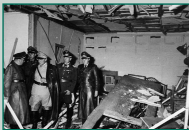
Besichtigung der zerstörten Barocke im Führerhauptquartier nach dem Attentat 1944