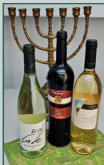
Koscherer Wein aus Israel

Persönliche Anmeldung im Kreisarchiv erforderlich! Maximale Teilnehmerzahl: 30 Personen. Anmeldung: Tel. 02241/13-2928 oder Fax 02241/13-3271 oder gedenkstaette@rhein-sieg-kreis.de