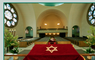
Innenansicht der Kölner Synagoge

Synagoge und Restaurant Koschere Kantine Weiß, Köln Teilnahmegebühr: 3,00 €, Fahrtkosten und Kosten für koscheres Essen trägt der Teilnehmer Führung mit Israel MELLER, Mitglied der Synagogen-Gemeinde Köln