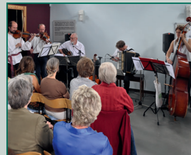
Klezmerkonzert der Gruppe Saitensprung

Gedenkstätte Windeck-Rosbach Eintritt: 10,00 €, erm. 8,00 € Klezmerkonzert mit der Gruppe SAITENSPRUNG