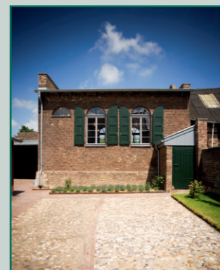
Hofansicht der ehemaligen Synagoge in Rödingen