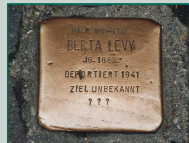
Stolperstein in der Siegburger Holzgasse

Treffpunkt: Stadtmuseum Siegburg, Am Markt 46, 53721 Siegburg - Eintritt frei Führung mit Bertrand STERN, Siegburg