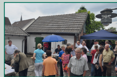
Tag der offenen Tür 2009

JUNI Sonntag, 20. Juni 2010, 11.00 – 17.00 Uhr Gedenkstätte Windeck-Rosbach - Eintritt frei