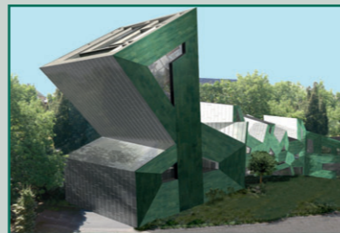
Modell der geplanten neuen Synagoge in Mainz