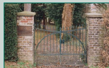
Eingangstor zum jüdischen Friedhof