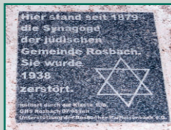
Gedenktafel für die 1938 zerstörte Rosbacher Synagoge

Gedenkstätte Windeck-Rosbach - Eintritt frei